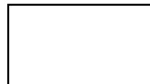
Polegar direito 2